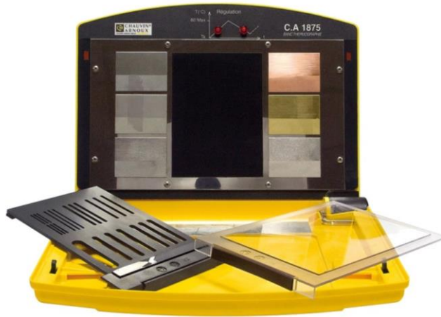
Fig 2. Panel de caracterización de emisividades de diferentes superficies metálicas.